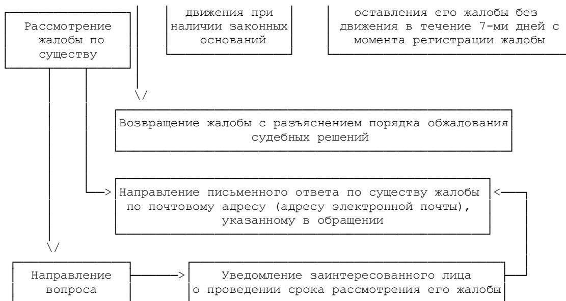
Рисунок 2 - Рассмотрение жалоб на решения или действия (бездействие) надзорных органов в области ЧС и их должностных лиц

13.2. Персональная ответственность за исполнение государственной функции закрепляется в функциональных обязанностях должностных лиц надзорных органов.