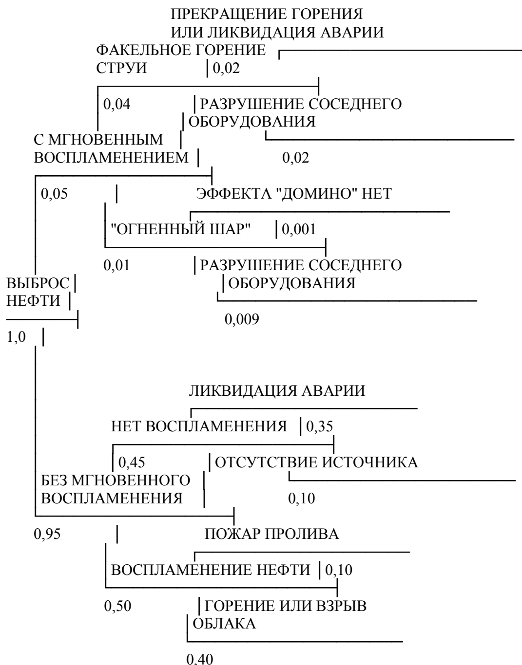
Рис. 2. "Дерево событий" аварий на установке первичной переработки нефти

Пример дерева событий для количественного анализа различных сценариев аварий на установке переработки нефти представлен на рис. 2. Цифры рядом с наименованием события показывают условную вероятность возникновения этого события. При этом вероятность возникновения инициирующего события (выброс нефти из резервуара) принята равной 1. Значение частоты возникновения отдельного события или сценария пересчитывается путем умножения частоты возникновения инициирующего события на условную вероятность развития аварии по конкретному сценарию.