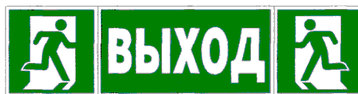
Конечный эвакуационный выход (при наличии двух направляющих линий в коридорах шириной более 2 м и помещениях большой площади) 2)