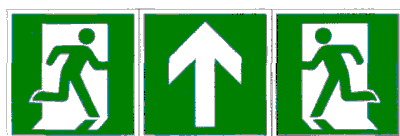
Прямо (при наличии двух направляющих линий в коридорах шириной более 2 м и помещениях большой площади) 1)